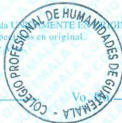
Secretario de Junta Directiva